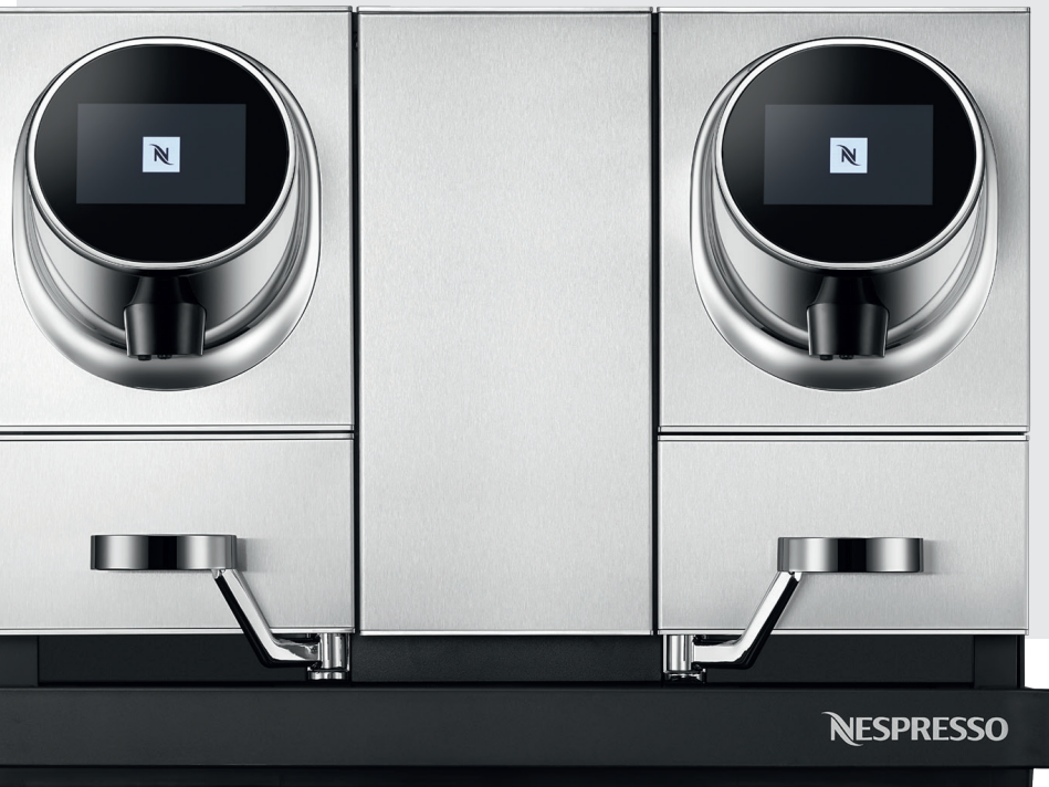
Momento Coffee & Coffee Büro, Gastronomie, Hotel