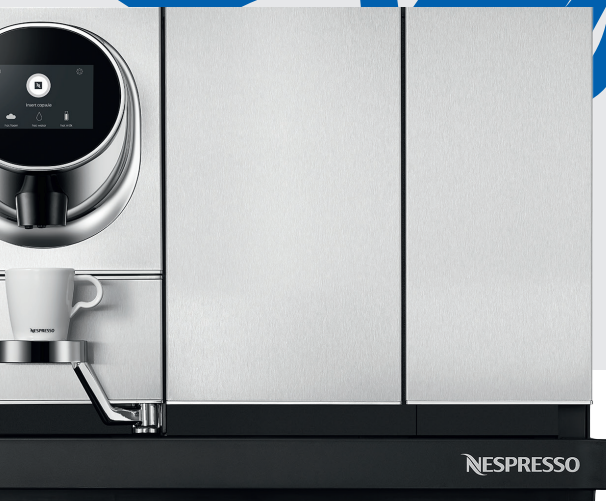
Momento Coffee & Milk Büro, Gastronomie, Hotel