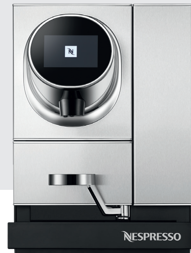
Momento Coffee Büro, Small Business, Gastronomie