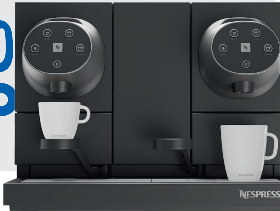
Momento Black Büro, Gastronomie, Hotel